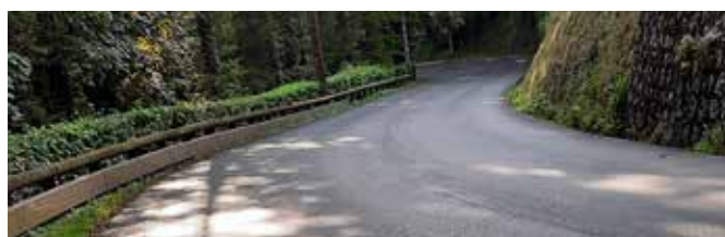
Travaux d'entretien des voies publiques en divers points de la commune