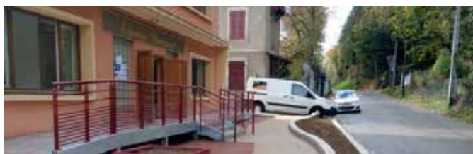
Équipement et rajeunissement des salles de l'Espace Versoud - Photo de gauche : entrée de la salle La Cime - Photo de droite : Vue à l'arrière de la Poste avec accès à la salle La Forêt par l'ascenseur (réservé PMR) et par les escaliers métalliques + entrée de la salle Les Vallons, à gauche de l'ascenseur