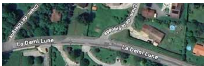
Aménagement de sécurité à « La Demi Lune », avec notamment ajout d'un trottoir