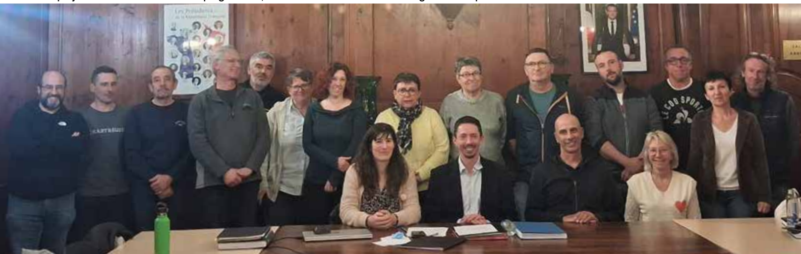
Dernier conseil municipal de l'équipe des élus 2020-2026 qui a voté à l'unanimité le budget 2026 pour St Geoire

de la voirie dans le secteur de La Demi Lune, ainsi que des travaux d'entretien sur différentes voies de la commune. Une enveloppe spécifique est également prévue pour moderniser et équiper les salles de l'espace Versoud, dont certaines présentent aujourd'hui des signes de vétusté. Par ailleurs, afin d'anticiper les besoins futurs, des études seront lancées pour la réhabilitation du gymnase communal. De même, dans l'objectif de garantir la pérennité et le bon fonctionnement de la piscine municipale, un bureau d'études sera missionné pour accompagner la commune dans la définition des travaux à réaliser. Enfin, fidèle à ses engagements, le conseil municipal a décidé de maintenir les taux d'imposition communaux à leurs niveaux actuels, sans aucune augmentation pour les habitants.