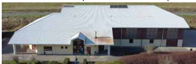
Lancement d'une étude pour réhabiliter le gymnase (salle polyvalente) à la Martinette