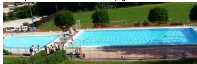
Lancement d'une étude pour pérenniser la piscine qui montre des signes de fragilisation